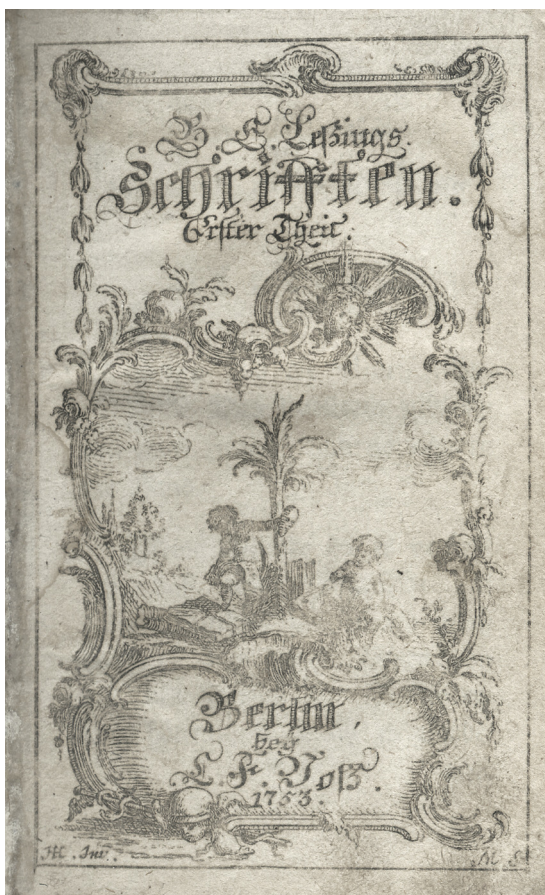
Lessing, G.E. Schriften, 1753 - 1755.